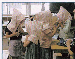
1年生も練習しました